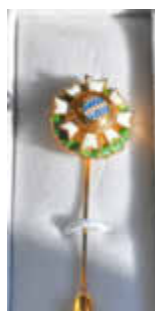
Ehrenzeichen des Bayerischen Ministerpräsidenten für Verdienste im Ehrenamt.

Das Ehrenzeichen des Bayerischen Ministerpräsidenten wird seit 1994 als ehrende Anerkennung für langjährige hervorragende ehrenamtliche Tätigkeit verliehen. Der Ministerpräsident verleiht sein Ehrenzeichen an Personen, die sich mit ihrer aktiven Arbeit in Vereinen, Organisationen und sonstigen Gemeinschaften mit kulturellen, sportlichen, sozialen oder anderen gemeinnützigen Zielen herausragende Verdienste erworben haben - vorrangig im örtlichen Bereich und seit mindestens 15 Jahren. Die erbrachten Verdienste dürfen grundsätzlich nicht länger als fünf Jahre zurückliegen. Aus Gründen der Vertraulichkeit und um keine falschen Erwartungen zu wecken, soll der Vorgeschlagene nicht in die Anregung einbezogen werden.